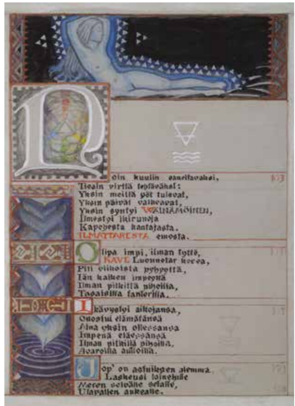
Akseli Gallen-Kallela (1865-1931), Ilmator, Illustration pour le Grand Kalevala, Chant I, années 1920. Aquarelle, 41,5 x 33 cm. Musée Gallen-Kallela, Espoo.

Le grand mythe du Kalevala , collecté auprès des bardes de Carélie, dans l'Est de la Finlande, avait servi de sujet à de nombreuses peintures d'Akseli Gallen-Kallela dans les années 1890. Ses peintures étaient devenues emblématiques du Romantisme national et avaient contribué à forger l'identité nationale finlandaise à la fin du XIX e siècle. Lorsqu'il retourna au Kalevala dans les années 1920, la Finlande