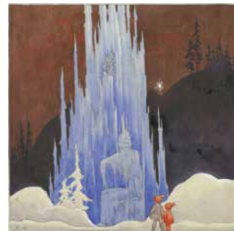
Rudolf Koivu (1890-1946), illustration pour Frère et sœur , 1929. Aquarelle, 39 x 29 cm. Fondation Amer / Musée des beaux-arts de Tuusula.