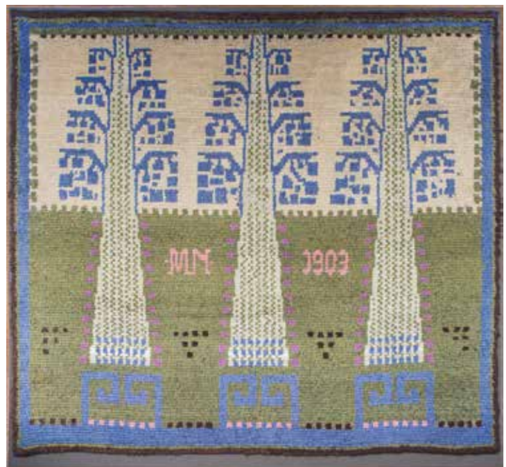
Eliel Saarinen et les Amis finlandais des travaux manuels, Ryijy pour le manoir de Suur-Merijoki , 1903. 192 x 222 cm. Centre des musées Vapriikki, Tampere.

qui soulignent la dimension onirique de la résidence d'été de la famille Neuscheller.