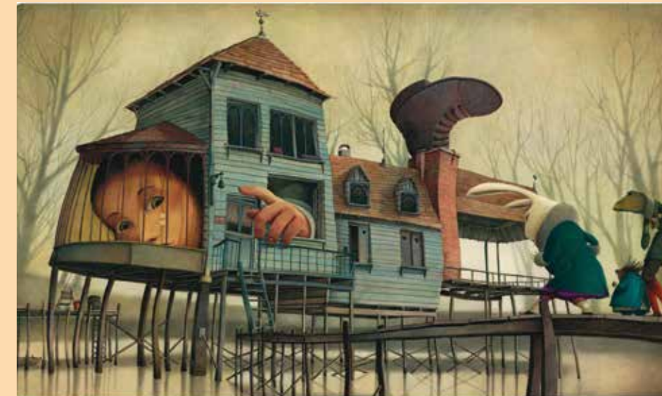
Rebecca Dautremer, Alice au pays des merveilles , 2010, gouache marouflée sur médium. Coll. De l'artiste © Nez brouillé.