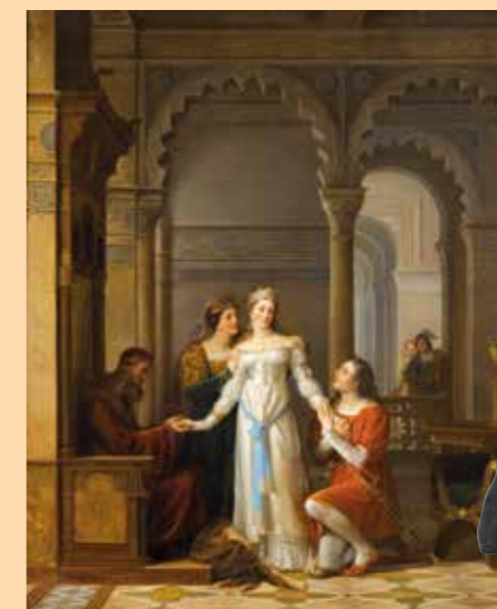
Jean-Antoine Laurent, Peau d'âne , 1819. Huile sur toile. Coll. Bourg-en-Bresse, musée du Monastère royal de Brou ©Hugo Maertens

Jim Dine, Two Thieves, One liar , 2006, bois calciné et bois peint. Courtesy Galerie Daniel Templon, Paris & Brussels © Jim Dine/ADAGP, Paris 2014