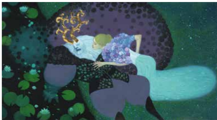
David Sala, La Mort de la Bête , 2014, huile sur papier. Coll. De l'artiste © David Sala