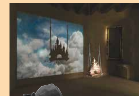
Katia Bourdarel, L'Expérience verticale , 2006, bois et vidéo-projection sonore. © Katia Bourdarel/Courtesy Galerie Eva Hober, Paris.