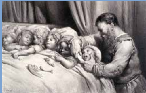
Gustave Doré, L'Ogre , 1867, gravure sur bois. Coll. MAMCS

À partir du XX e siècle, les images se veulent davantage décalées, parodiques, impertinentes, afin d'entrer en connivence ou en confrontation avec le texte. Selon les époques, Gustave Doré , Arthur Rackham , Edmond Dulac , William Crane ont livré paysages, décors et protagonistes. À leur tour le théâtre, les marionnettes, l'opéra et le cinéma – Méliès , Cocteau , Demy – ont fait vivre des personnages entrés dans la légende.