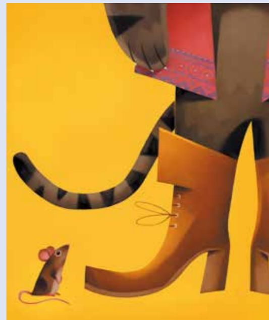
Raphael Gauthey, Le Chat botté , 2013, tirage numérique. Coll. De l'artiste © Raphael Gauthey

Outre les collections privées, artistes et illustrateurs contemporains, les œuvres proviennent de fonds variés parmi lesquels : la Cinémathèque française, le musée des Arts décoratifs, la Bibliothèque nationale de France, la Bibliothèque-musée de l'Opéra de Paris, le musée de l'illustration jeunesse de Moulins, le musée d'Art moderne et contemporain de Strasbourg, la bibliothèque Forney, la médiathèque de l'Architecture et du Patrimoine, le musée des Lettres et Manuscrits, le musée du