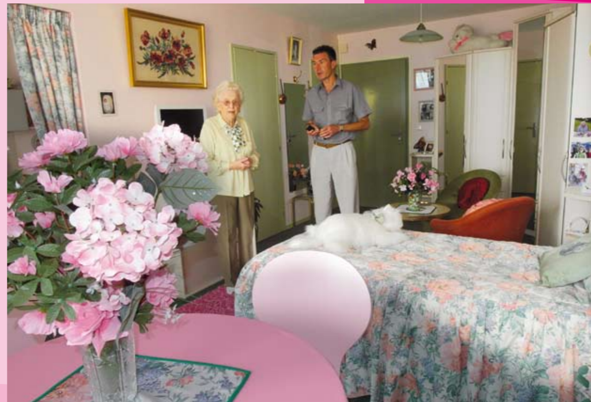
Un exemple d'appartement.

Pour préserver leur intimité, les résidents aménagent eux-mêmes leur logement à leur goût avec leurs propres meubles.