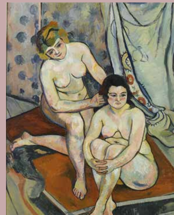
Suzanne VALADON, Les Baigneuses , 1923. Coll. Musée des Beaux-Arts de Nantes

Déambulation poétique à deux voix à l'occasion de la Saint-Valentin, suivie d'un apéritif offert aux participants. La parole sera donnée aux femmes artistes et poètes, ces belles d'un jour. Palais Lumière, 11h et 17h (durée 1h). 4€ en plus du ticket d'entrée.