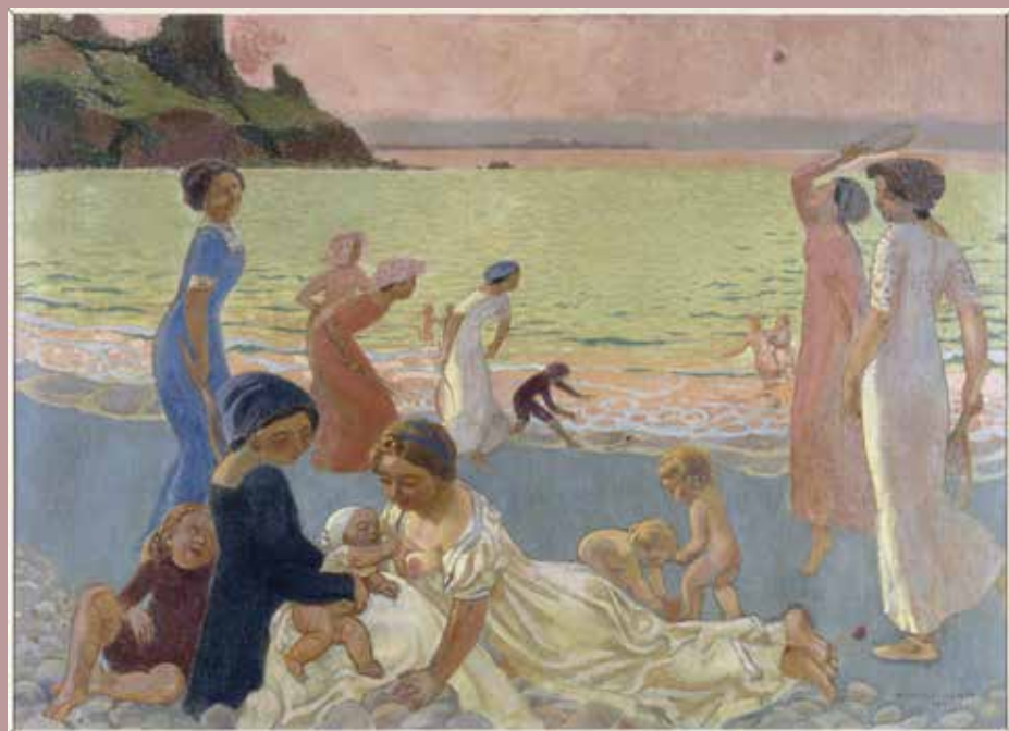
Maurice Denis, Soir de septembre , 1911. Huile sur toile. Coll. Musée des Beaux-Arts de Nantes © RMN-Grand Palais / Gérard Blot.