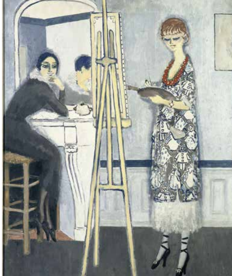
Kees Van Dongen, Passe-temps honnête , vers 1920. Huile sur toile. Coll. Musée des Beaux-Arts de Nantes

Palais Lumière, 14h-16h. Atelier précédé d'une courte visite de l'exposition (30 min). Sur réservation au 04 50 83 15 90 : 8€ / enfant les 2 jours.