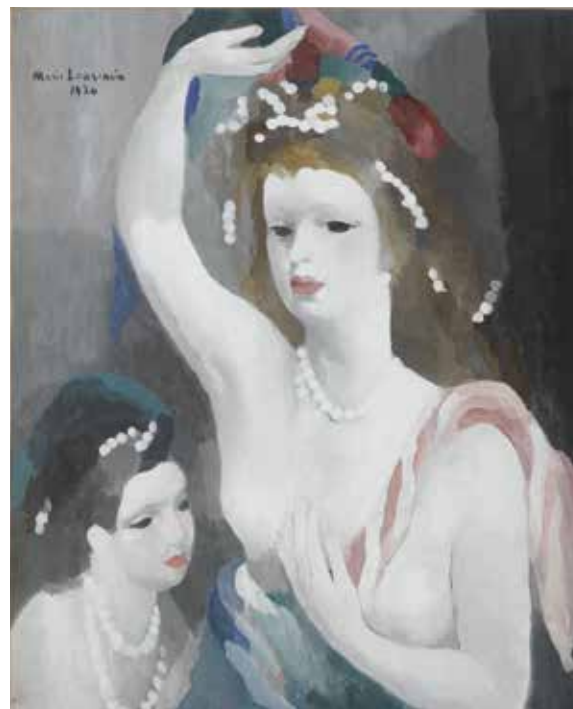
Marie Laurencin, Judith , 1930. Huile sur toile. Coll. Musée des Beaux-Arts de Nantes © Fondation Foujita / ADAGP, Paris 2016

Palais Lumière, 4€ en plus du ticket d'entrée à l'exposition.