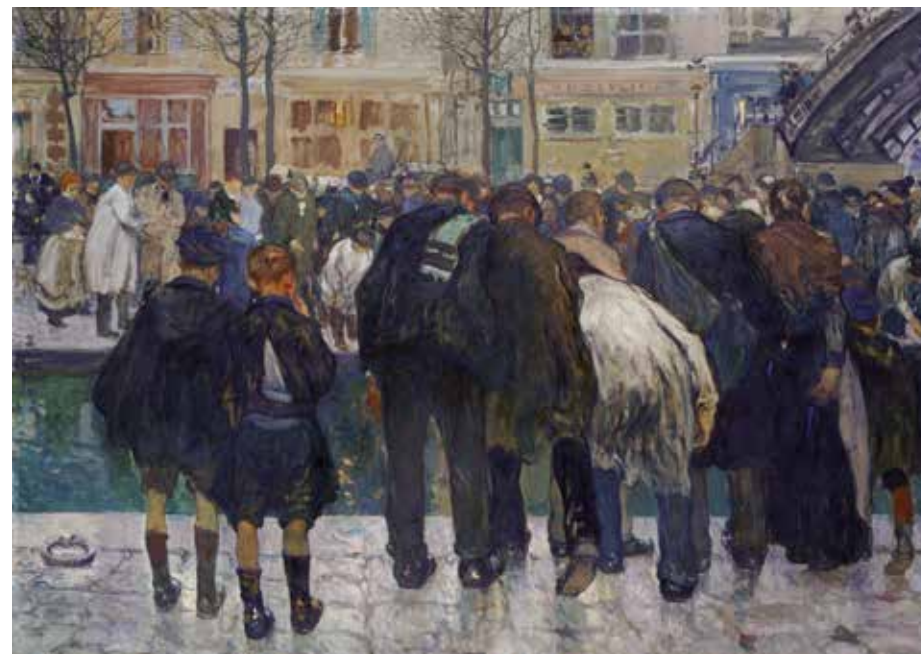
Jules Adler, L'Accident , 1912. Huile sur toile. Centre national des arts plastiques, Paris En dépôt au musée des Beaux-Arts de Dijon © ADAGP, Paris 2018

Auditorium du Palais Lumière, 19h15. Gratuit (offerte grâce au mécénat des Amis du Palais Lumière).