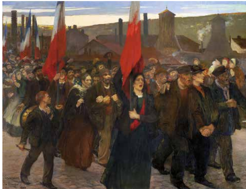
La Grève au Creusot, 1899. Huile sur toile © Musée des Beaux-Arts de Pau © ADAGP, Paris 2018.

Sur réservation au 04 50 83 15 90: 8 € / enfant les 2 jours.