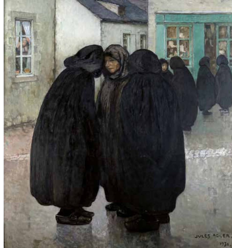
Deuil en Limousin, 1931. Huile sur toile © Musée de la Tour des Echevins, Luxeuil-Les-Bains © ADAGP, Paris 2018.