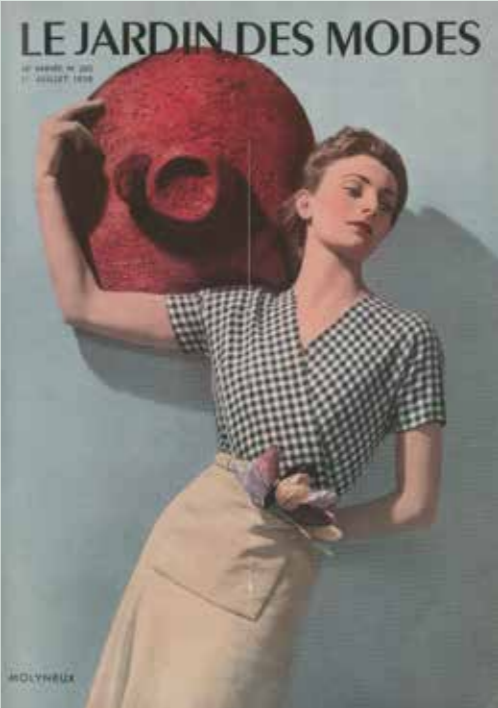
Le Jardin des Modes n° 260, 1 er juillet 1938

Le Jardin des Modes se veut un « magazine de luxe réellement pratique ». À ce titre, que ce soit les dessins ou les photographies, les illustrations sont destinées à faciliter la tâche des couturières. Les principaux photographes du