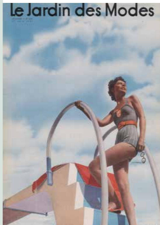
Le Jardin des Modes n°260, 1 er juillet 1938