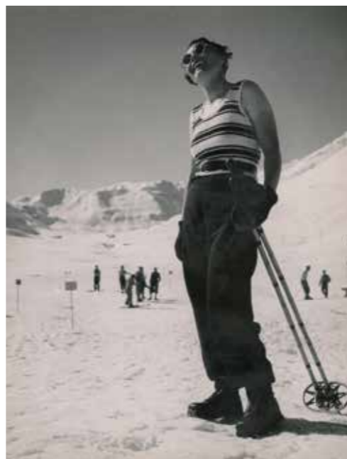
Jean Moral, Portrait de Juliette, Années 1930