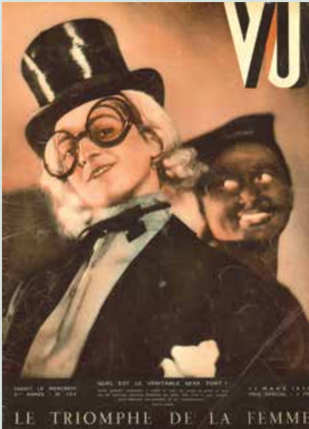
Alban, VU n°104, 12 mars 1930

En 1933 s'engage une collaboration fructueuse avec Harper's Bazaar . Seul photographe français exclusif pour le célèbre magazine, Jean Moral a un style qui correspond à la nouvelle ligne graphique et éditoriale du nouveau Harper's Bazaar : prises de vue hors du studio, angles de vue audacieux et instantanéité. Jean Moral use de tous les outils à sa disposition pour donner à voir la femme des années 1930, une femme moderne, chic, urbaine, dynamique et évidemment parisienne.