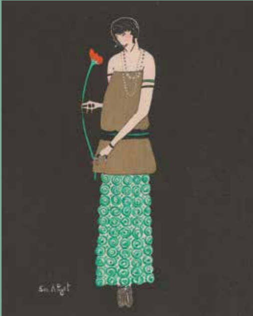
Simon Puget, Le Lys rouge . La Gazette du Bon Ton , 1914

Alors que plusieurs studios semblent vouloir se spécialiser dans la photographie de mode, les coûts d'impression limitent l'utilisation de la photographie dans la presse. Le dessin et sa reproduction par la gravure restent privilégiés.