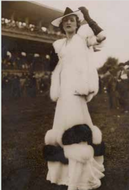
Agence Rol, Portrait au champ de courses , 1930

Dans les premières décennies du XX e siècle , peu à peu la photographie prend une place significative, notamment dans la presse non spécialisée : L'Art vivant et autres revues théâtrales assurent la promotion des toilettes à la mode, par le biais de la photographie, avec une démarche quasi journalistique (studio Séeberger