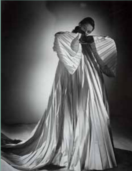
Maurice Tabard, Mode pour Vogue , 1947

À la fin du XIX e siècle , la photographie de mode va s'inspirer largement des techniques du « Pictorialisme ». Ce mouvement photographique n'a qu'une obsession, faire de la photographie un objet constitutif des beaux-arts. Ces techniques appliquées à la photographie de mode ne convoitent pas le naturel mais, au contraire, accentuent la théâtralité de la scène. Ce que veulent les photographes de mode est la constitution d'une atmosphère intime et néanmoins mondaine.