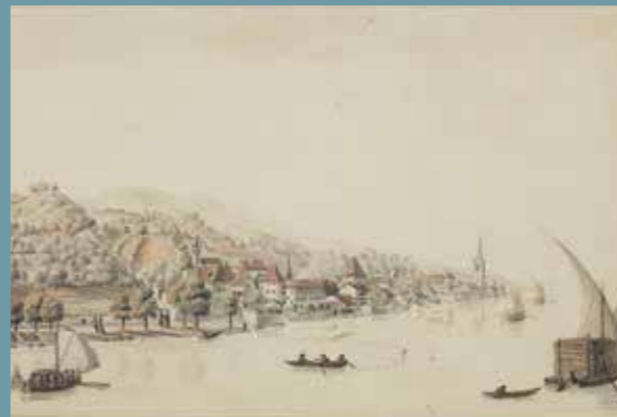
Pierre Escuyer, Evian , XIX e siècle, aquarelle et gouache, Coll. musée du Chablais, dépôt A.M. Thonon © Musée du Chablais – ETH productions.