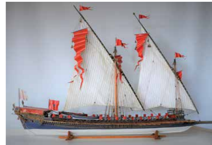
Maquette de la Galère La Réale de France, coll. F. Graviou

Consultation sur les postes informatiques : entrée libre tous les jours de 14h à 18h à la Maison Gribaldi et à l'espace multimédia de la Médiathèque C.F. Ramuz aux horaires d'ouverture.