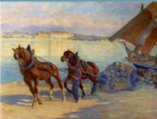
Laurent Zubritzky, Le déchargement des pierres de Meillerie , 1929, coll. privée.