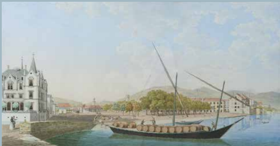
Steinlen Christian Gottlieb dit Théophile, Barque chargée de tonneaux au bas de la Place du Marché, 1818-1846, aquarelle, Vevey, musée historique

continuent ainsi à être ce qu'elles ont toujours été, un trait d'union entre les rives.