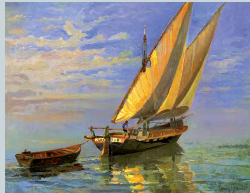
Louis Baudit, La Savoie par vent arrière, 1930, coll. Privée.