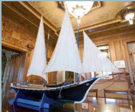
Maquette de La Neptune , coll. Ville d'Evian (Sébastien Doutard).

C'est cette histoire que se propose de raconter l'exposition présentée à la Maison Gribaldi à travers de nombreux documents, objets, maquettes et peintures provenant de collections suisses et françaises. Les barques du Léman