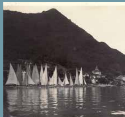
Meillerie, le port , Perrochet & David, coll. P. Flury.