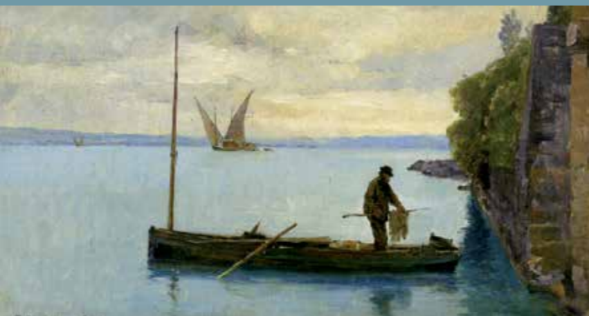
François Bocion, Pêcheurs dans sa barque , coll. privée.