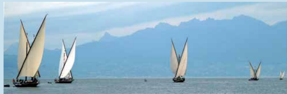
Grand rassemblement des barques du Léman les samedi 24 et dimanche 25 juin.

• Concert jazz , parvis devant la Maison Gribaldi, à 15h et 17h. Entrée libre.