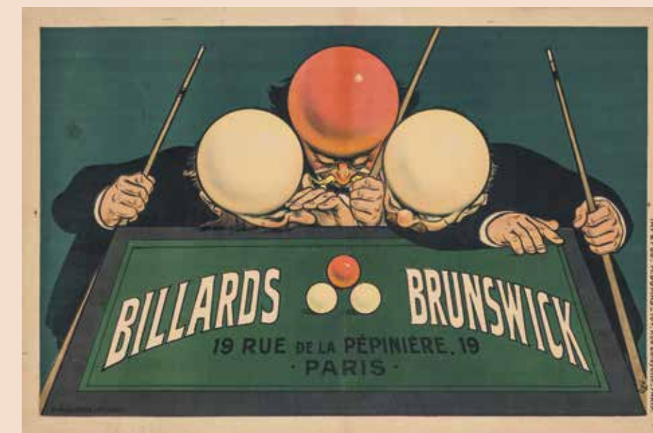
Eugène Ogé, Affiche, Billards Brunswick , 1910. Lithographie couleur, 79 x 118 cm, collections du musée des Arts décoratifs