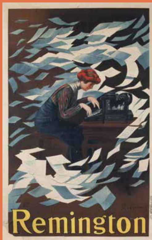
Leonetto Cappiello, Affiche, Remington , vers 1910. Lithographie couleur, 200 x 130 cm, collections du musée des Arts décoratifs

Auditorium du Palais Lumière, 17h. 16€/13€ (tarif réduit). Inclus une visite de l'exposition pendant les heures d'ouverture au public. Billetterie et réservation à l'accueil.