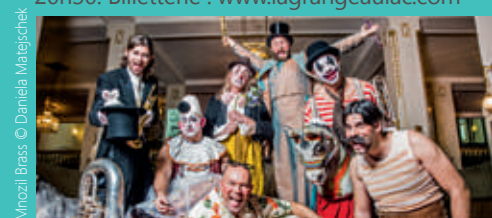
Mnozil Brass

Spectacle Mnozil Brass, entre musique et humour, soirée réussie garantie avec ces rois de l'acrobatie instrumentale. La Grange au lac, 20h30. Billetterie : www.lagrangeaulac.com