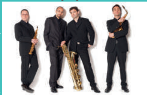
Quatuor Habanera

Concert « 100 sax à la Grange » proposé par le conservatoire en lien avec la Maison des arts du Léman. Un programme éclectique pour découvrir la richesse des orchestres de saxophone. La Grange au Lac , 17h30. Entrée libre. Suivi du Concert « Quatuor Habanera » autour des œuvres de Tchaïkovski, Glazounov, Prokofiev, Chostakovitch... La Grange au Lac , 20h. Billetterie : www.lagrangeaualac.com