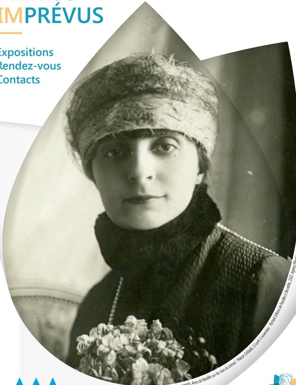
Exposition "Gouter au paradis, Anna de Noailles sur les rives du Léman", Maison Gabrielle, 13 juin-3 novembre - "Portrait d'une reine de Noailles à lavender", 1922