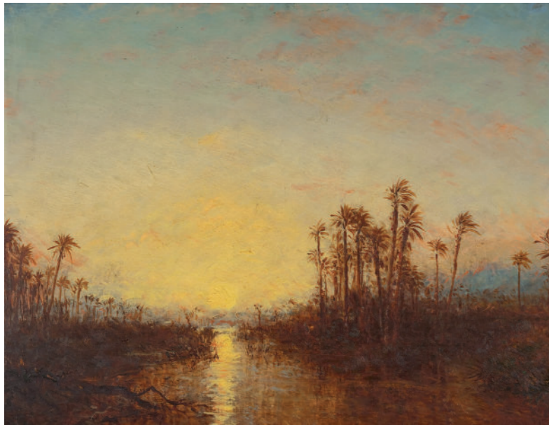
Félix Ziem, Khartoum, coucher de soleil, entre 1885 et 1890, huile sur bois © Paris Musées / Petit Palais, musée des Beaux-Arts de la Ville de Paris.

Palais Lumière (auditorium), 19h. Gratuit (offert grâce au mécénat des Amis du Palais Lumière).