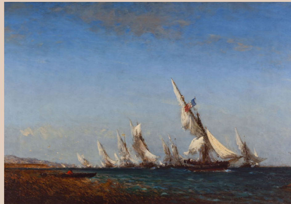
Félix Ziem, Rentrée des pêcheurs à Martigues, sans date, huile sur toile © Paris Musées / Petit Palais, musée des Beaux-Arts de la Ville de Paris.

Palais Lumière, durée 2h, visite de l'exposition incluse. 8 € / personne et 55 € / groupe. Peut être proposé à des groupes seniors EHPAD, CCAS, etc. 5€ / personne (gratuit pour les accompagnateurs).