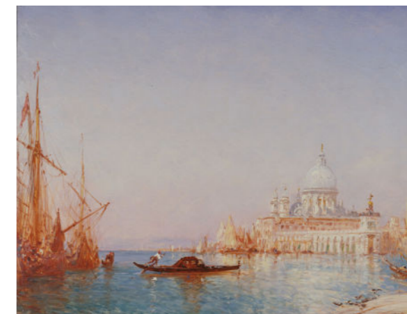
Félix Ziem, Venise, la Salute, effet du matin, entre 1860 et 1890, huile sur bois © Paris Musées / Petit Palais, musée des Beaux-Arts de la Ville de Paris.

Palais Lumière, 10-12h. Atelier précédé d'une visite de l'exposition. 5 € / enfant.