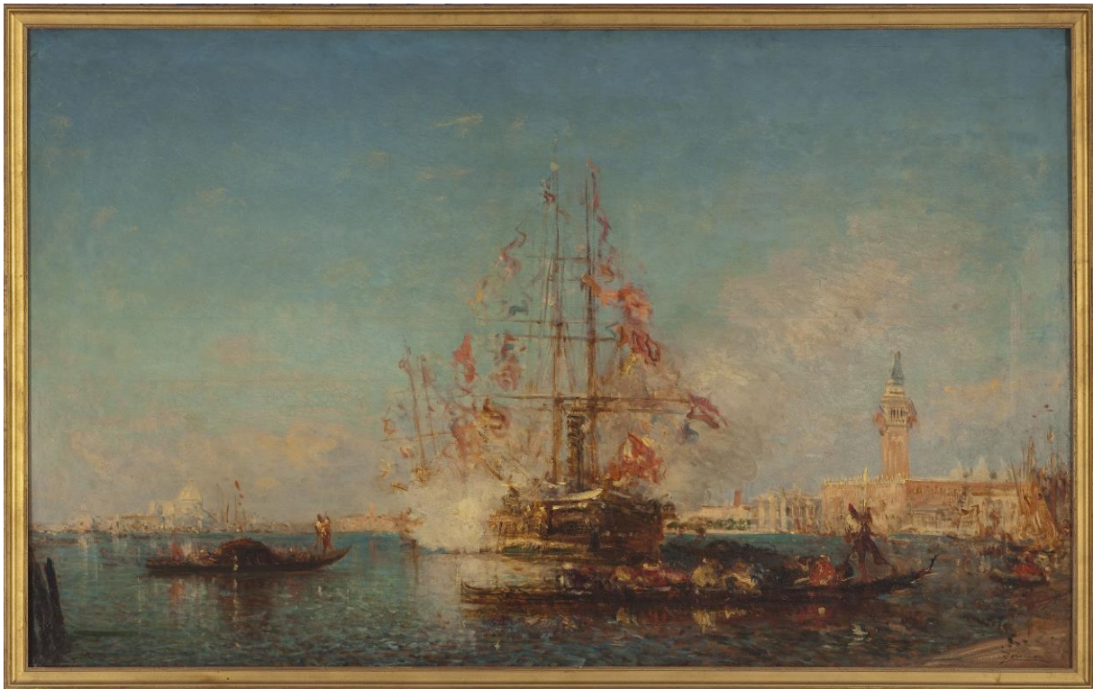
Félix Ziem. Le coup de Canon , 2 ème moitié du XIX ème siècle. Petit Palais, musée des Beaux-Arts de la Ville de Paris.

Une exposition conçue par le Petit Palais, musée des Beaux-Arts de la Ville de Paris, Paris Musées.