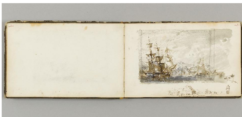
Félix Ziem. Carnet n°1 , entre 1850 et 1861. Petit Palais, musée des Beaux-arts de la Ville de Paris.

En présentant des œuvres majeures de ce peintre-voyageur ainsi que des pièces plus rares provenant du fonds d'atelier et permettant de comprendre le travail de l'artiste, Charles Villeneuve de Janti et William Saadé, commissaires de l'exposition, entendent proposer un regard nouveau sur ce peintre et sur son travail.