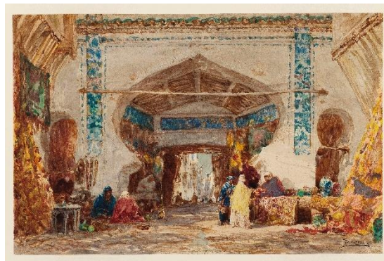
Félix Ziem. Bazar à Constantinople , 2 e moitié du XIX e siècle

Le Palais Lumière est le lieu idéal pour présenter l'œuvre d'un artiste qui a fait de l'eau et la lumière un thème central. Du 17 décembre 2023 au 21 avril 2024, découvrez de façon singulière l'œuvre de Félix Ziem (1821-1911), peintre-voyageur pré-impressionniste et orientaliste. Homme universel, il symbolise, dans sa quête d'une nature idéale, l'ouverture au monde.