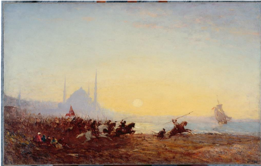
Félix Ziem. Fantasia à Constantinople , Entre 1880 et 1895. Petit Palais, musée des Beaux-arts de la Ville de Paris.