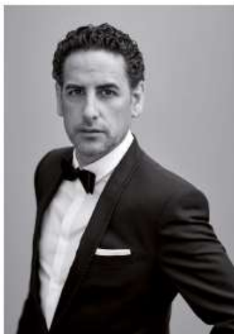
Juan Diego Flórez