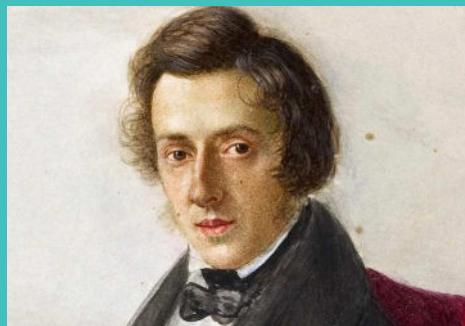
Frédéric Chopin en 1835