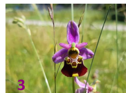
🔥 Orchis pyramidale (1) et Ophrys bourdon (3) sur la commune de Publier 🔥 Ophrys abeille (2) sur la commune de Marin