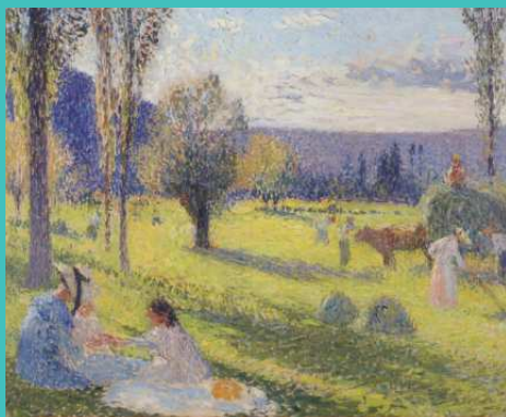
Henri Martin, Etude pour l'été, huile sur toile, avant 1914, Collection du musée de Grenoble