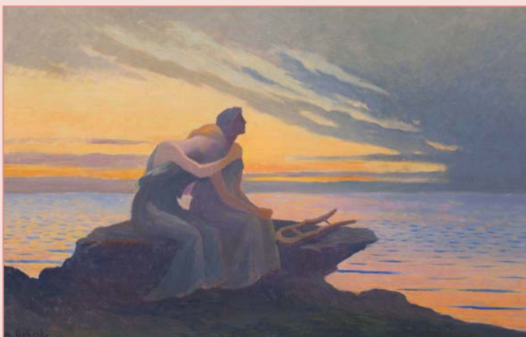
Alphonse Osbert, Reve du soir, 1901, huile sur toile, coll. privée, photo Michiel Elsevier Stokmans.