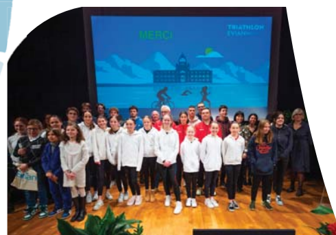
Les champions 2023.

Ce rendez-vous sera l'occasion de remercier les dirigeants et entraîneurs et plus largement les bénévoles qui s'investissent au sein de leurs clubs pour porter haut les couleurs évianaises.