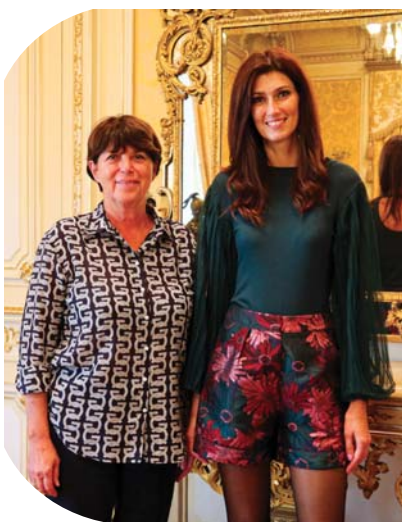
Sophie Vouzelaud est venue promouvoir l'accessibilité de la station éviannaise.

Des personnalités comme Romain Guérineau (alias Roro le costaud), tétraplégique et influenceur avec plus d'un million d'abonnés, ainsi que Sophie Vouzelaud, première dauphine de Miss France 2007, ont récemment découvert les installations accessibles d'Evian, valorisant cette démarche inclusive.