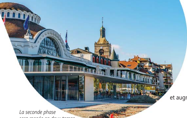
La seconde phase sera menée en deux temps, de septembre à décembre 2024 et de mars à avril 2025.