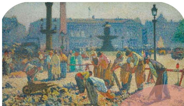
Henri Martin, Les Paveurs, huile sur toile, vers 1925, Collection particulière

Dimanche 5 janvier à 14h30, Yann Farinaux-Le Sidaner, commissaire de l'exposition proposera une visite commentée exclusive pour offrir un éclairage expert sur les œuvres exposées. La visite est ouverte dès 12 ans, pour un groupe limité à 25 personnes, sur réservation. Un supplément de 4 € est demandé en plus du billet d'entrée.