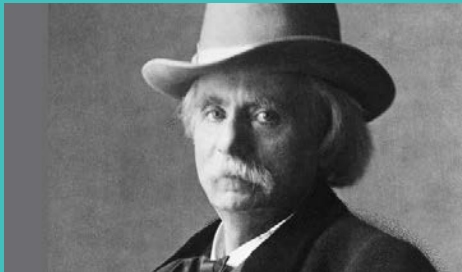
Edvard Grieg