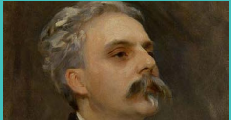
Gabriel Fauré, au piano, dans les années 1900.

Villa du Châtelet, 18h. 19 € / 16 € (membres Villa du Châtelet et associations amies).