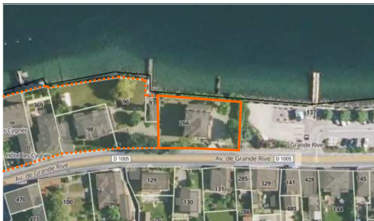
— Limite parcelle ..... Foncier à préserver