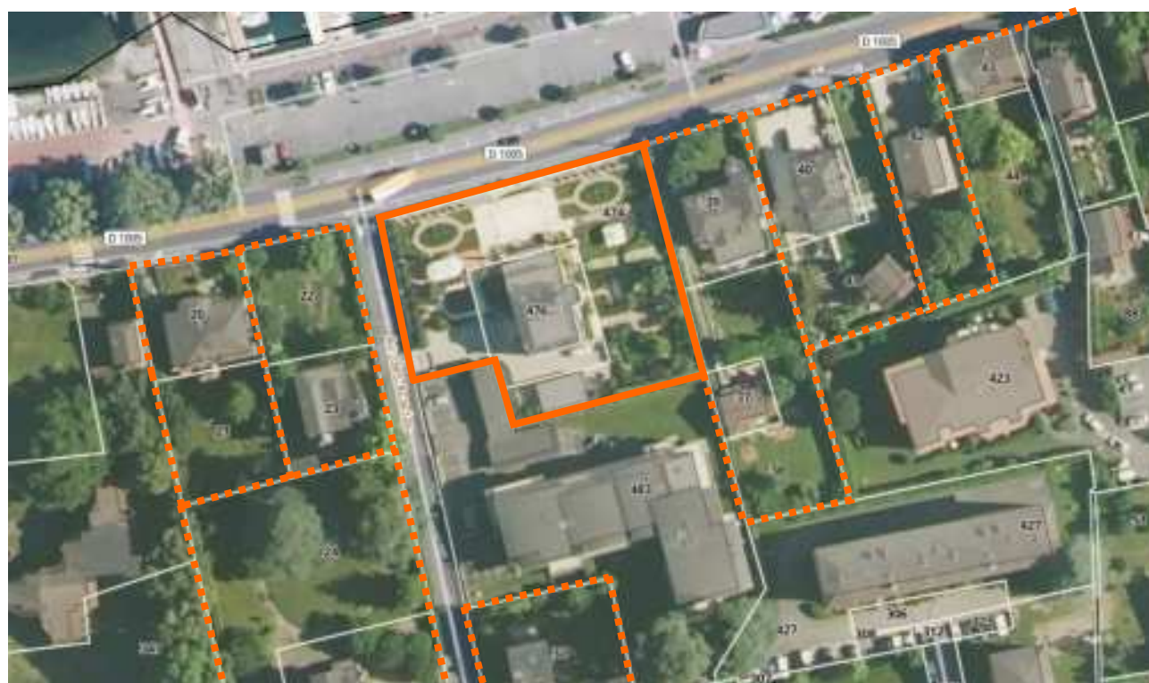
— Limite parcelle - - - - - Foncier à préserver