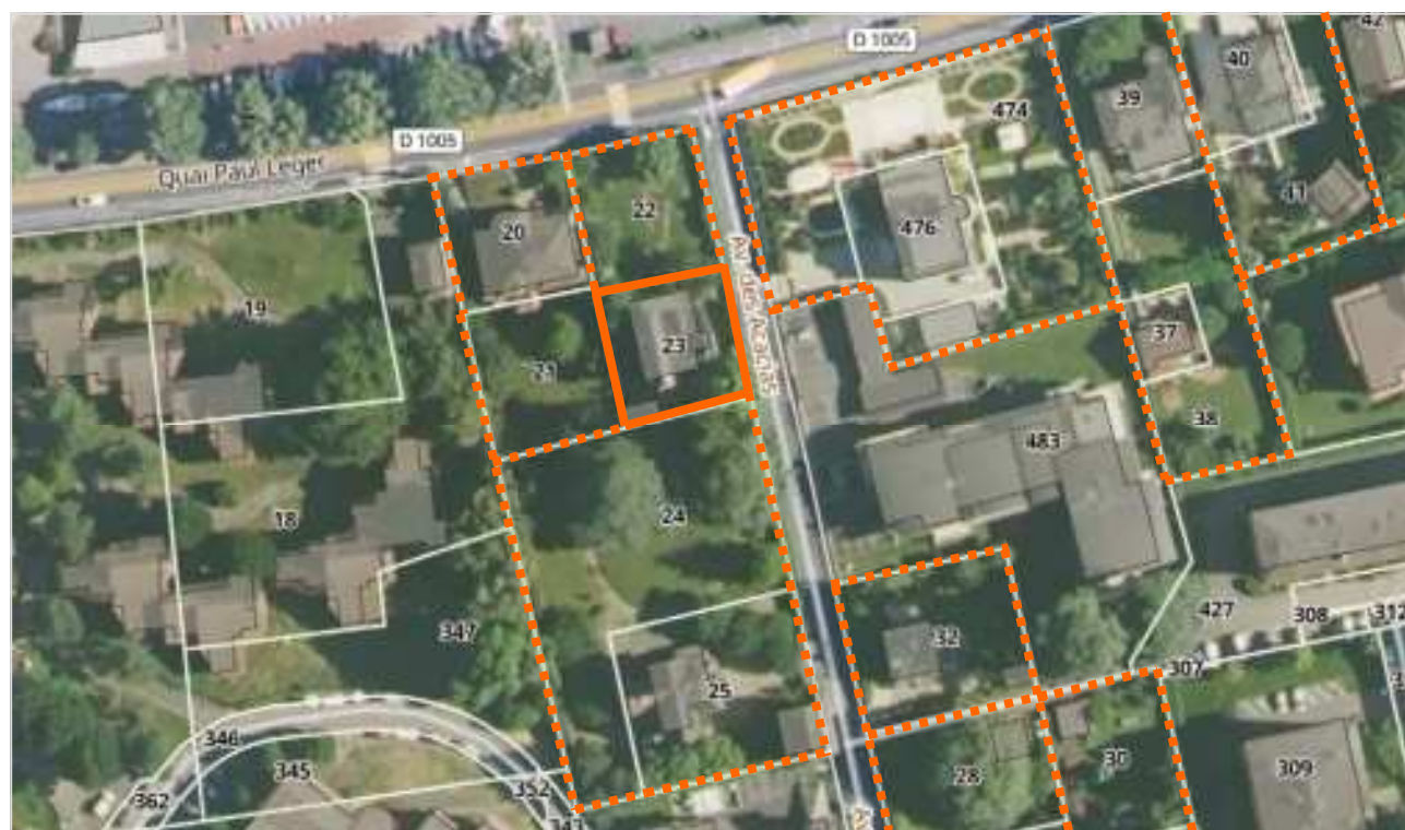
— Limite parcelle - - - - - Foncier à préserver