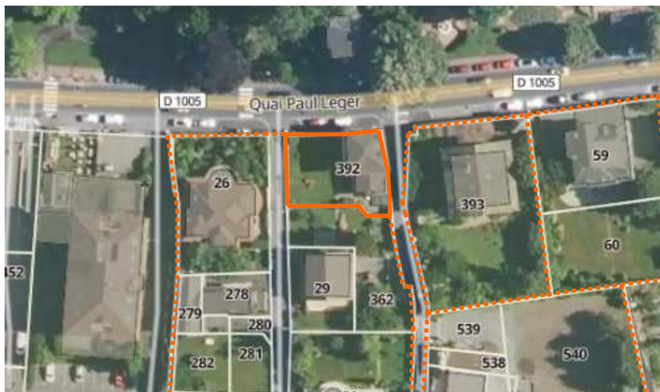
— Limite parcelle - - - - - Foncier à préserver