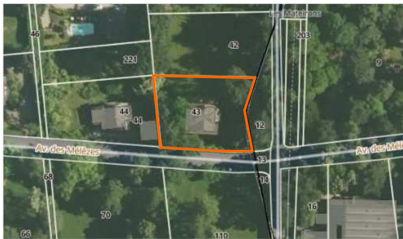
— Limite parcelle ..... Foncier à préserver