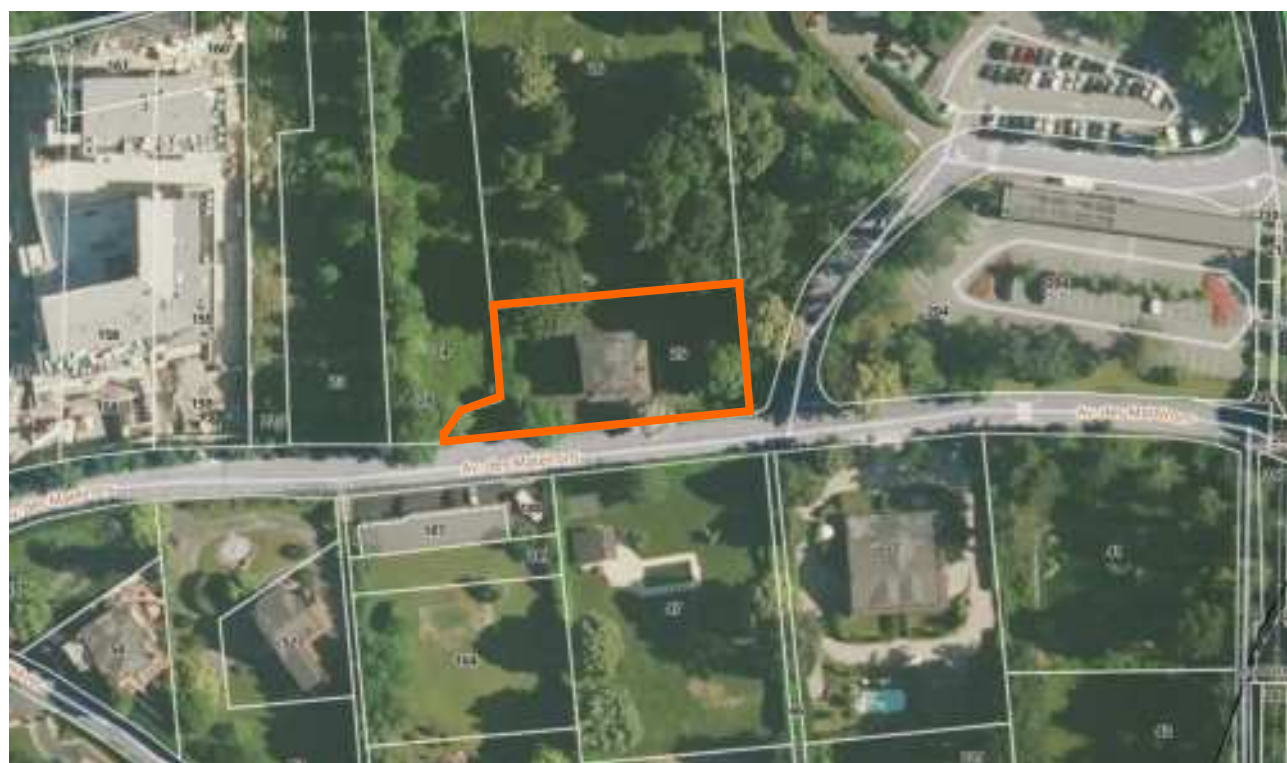
— Limite parcelle - - - - - Foncier à préserver