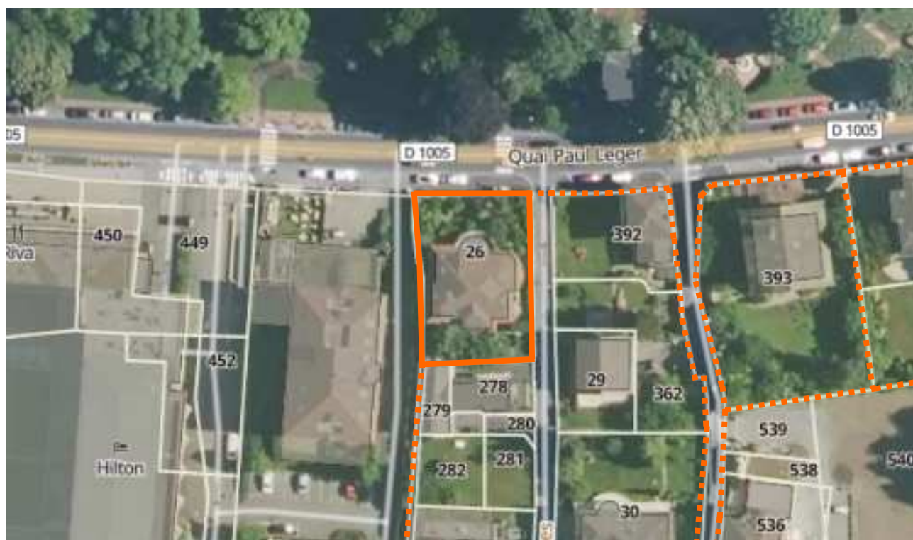
— Limite parcelle - - - - - Foncier à préserver