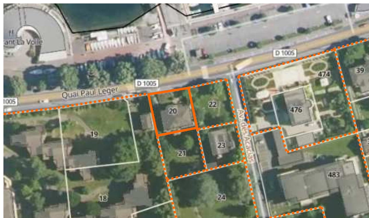
— Limite parcelle - - - - - Foncier à préserver