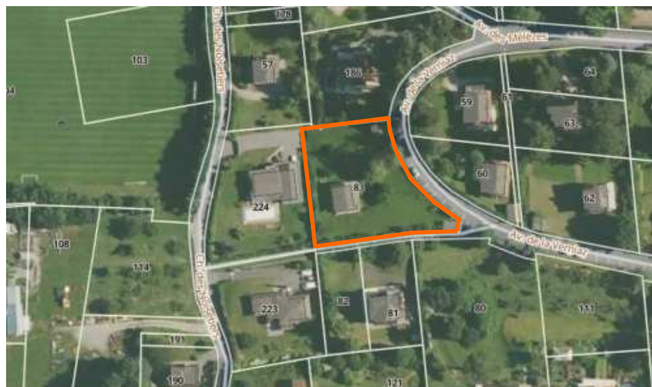
— Limite parcelle ..... Foncier à préserver