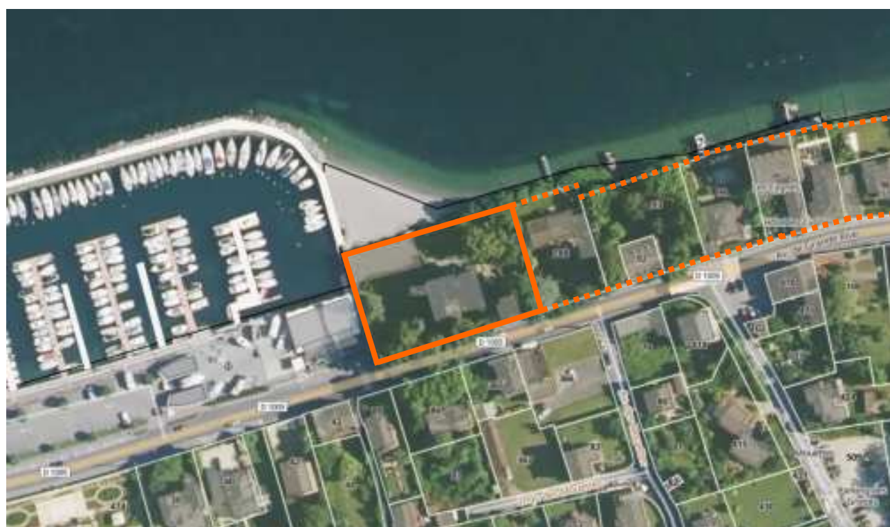
— Limite parcelle ..... Foncier à préserver