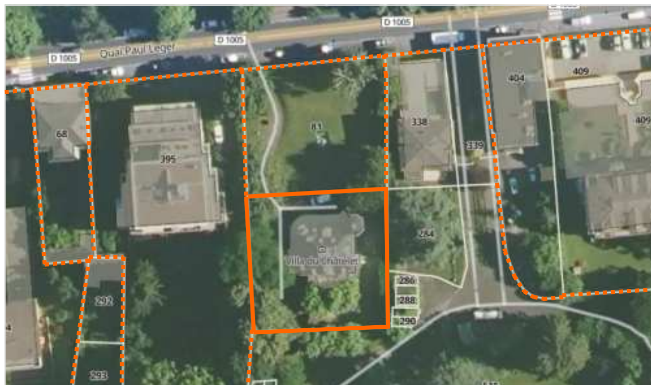
— Limite parcelle - - - - - Foncier à préserver