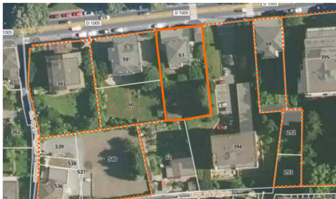
— Limite parcelle ..... Foncier à préserver