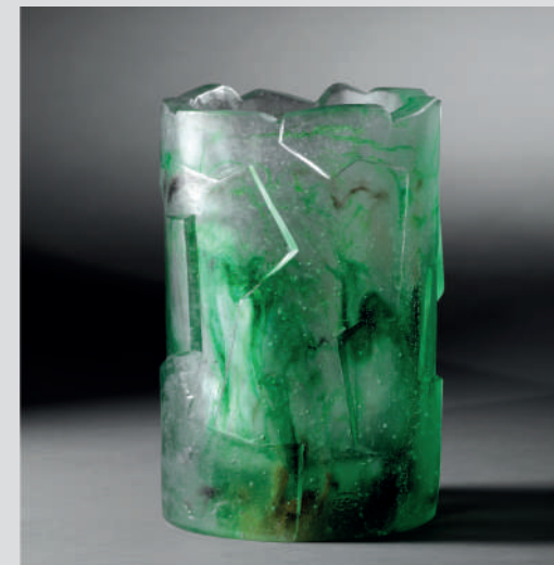
Erich Schamschula Vase-sculpture , pâte de verre translucide aux inclusions vertes, 24x15cm, 1982. Collection Hélène et Philippe Vaissière.