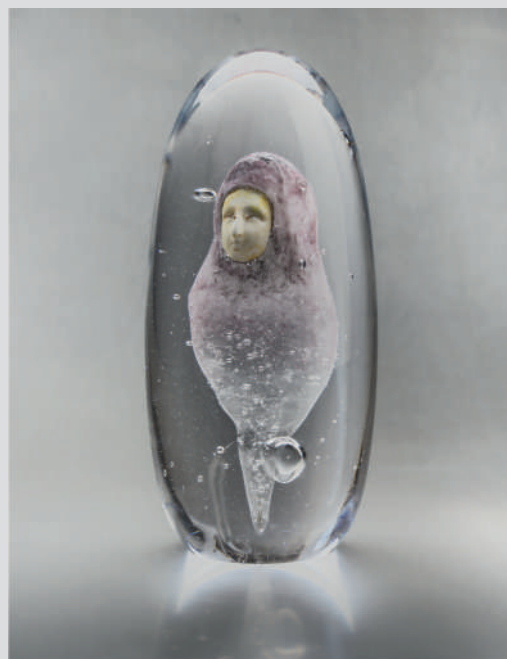
Sandrine Isambert, Aurae , verre coulé, inclusion pâte de verre émaillée, 2016. Courtoisie de l'artiste. Photographie © François Golfier.