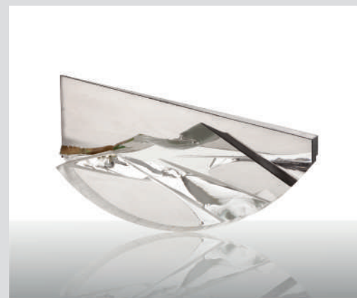
Matei Negreanu Sans titre , verre (optique) taillé, brisé, poli et bandes de plomb, 31,5x54,5x14cm, circa 95. Collection Denise et Marcel Heider.