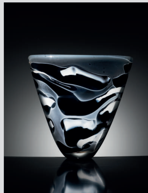
Marisa & Alain Bégou Pièce , verre soufflé, décors intercalaires, 28,7x29,2x8,5cm, 1988. Collection privée.