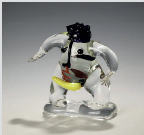
Juan Garcia Ripollés Hombre (Piccolo) , verre soufflé, 28x28x11cm, 2014. Collection Denise et Marcel Heider.

Une occasion pour les connaisseurs de goûter encore aux plaisirs de cet art et de se remémorer sa vitalité ; une occasion unique pour les non-initiés de découvrir des univers, des imaginaires, des approches conceptuelles et des savoir-faire. Une occasion pour tous de vivre une expérience exaltante.