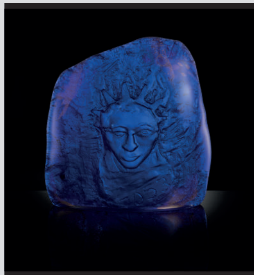
Yan Zoritchak, Star , verre fusionné, taillé, poli, 45x57x17cm, 2020.