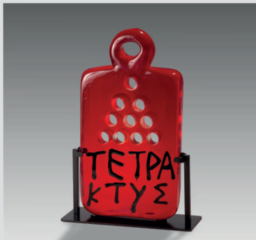
Joe Tilson Tetraktys 1 , verre soufflé troué, portant l'inscription grec « TETPAKTYΣ » plaquée à chaud (noir sur rouge), sur support en métal. 36,5x19,5x3,5cm, 2007. Collection Denise et Marcel Heider.