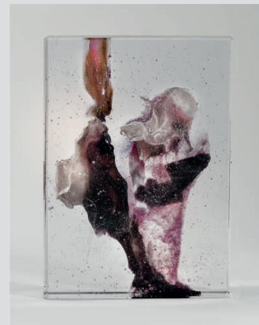
Antoine Leperlier Espace d'un Instant XXVIII , pâte de verre à inclusion triple cuisson, cadre acier noir, 33x33x24cm (verre), 80x59x20cm (cadre), n°2180117, 2018. Photographie avec l'autorisation de l'artiste.