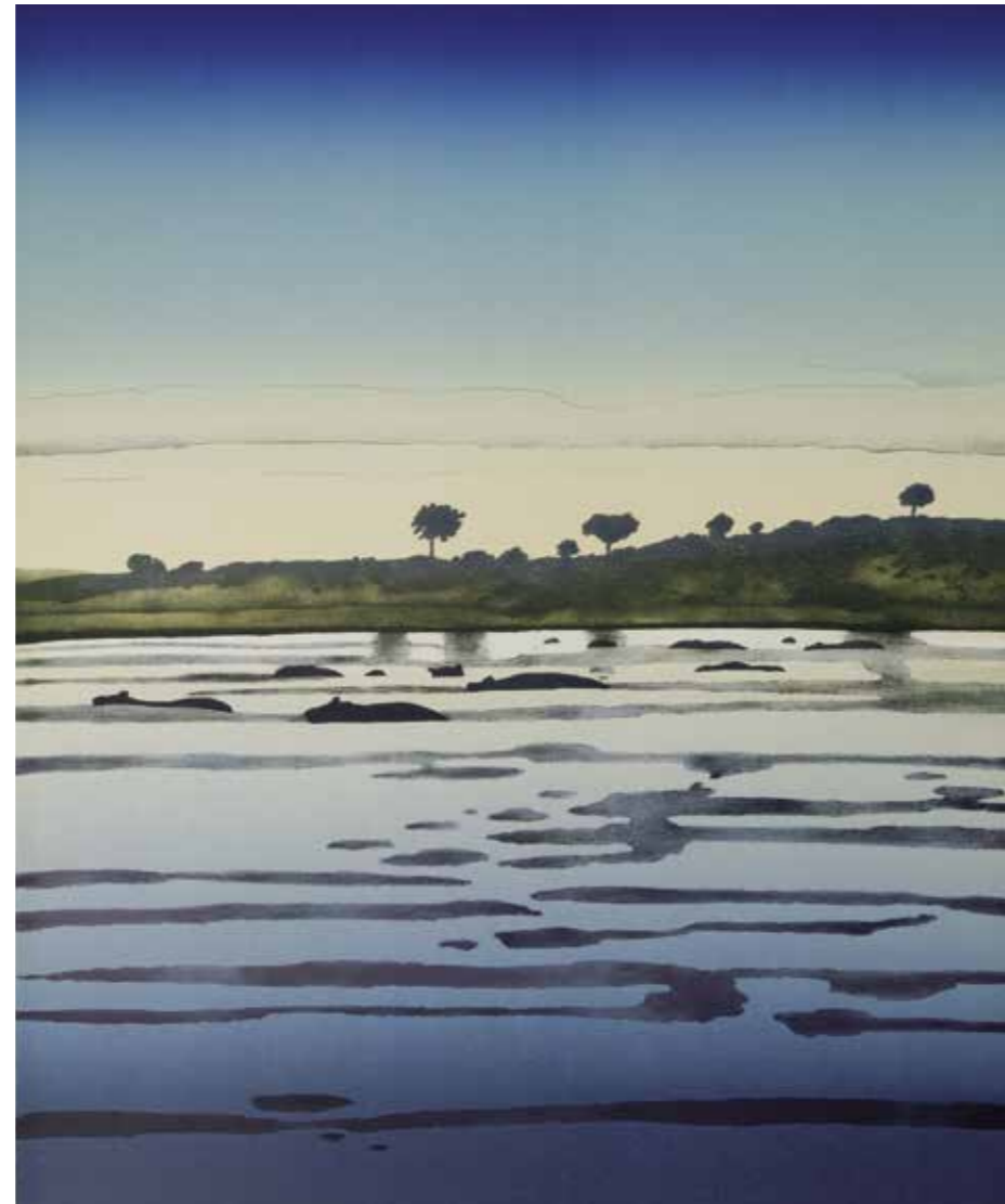
Mémoire d'Afrique. Le Nil Victoria, 1975, lithographie, 65 x 50,8 cm. Collection particulière.