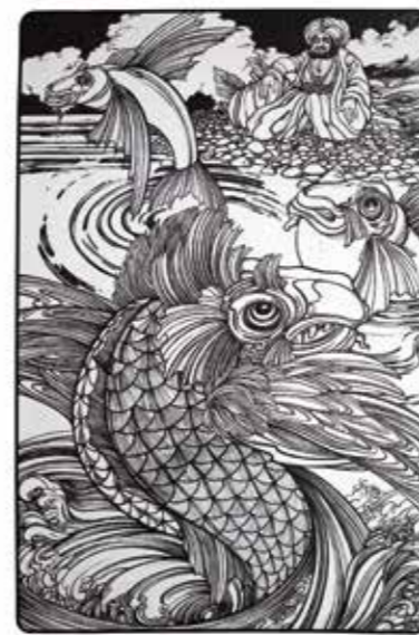
Dessin pour Sindbad le marin , 1969, encre, 47 x 30 cm. Collection particulière.

dans lesquels il propose un reportage en images de ses voyages en Italie et au Kenya.