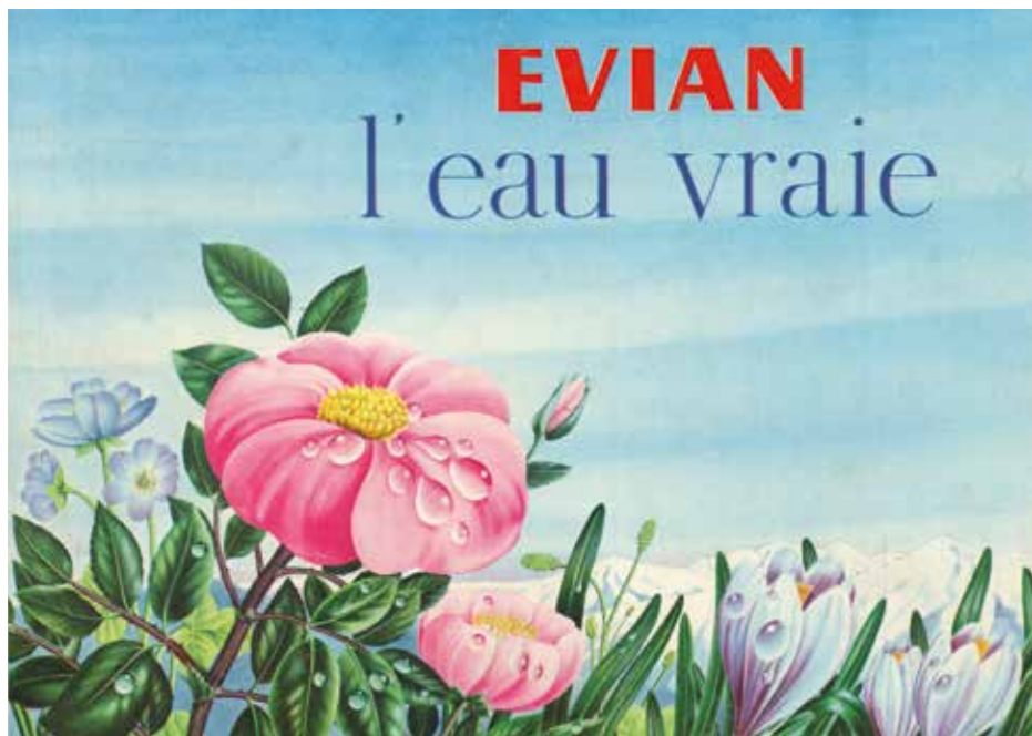
Publicité pour l'eau d'Evian, 1964.

varie en fonction du sujet traité. Alain Le Foll travaille également pour l'agence de Robert Delpire chargée des campagnes de Citroën et conçoit une plaquette publicitaire dans le style décalé des images d'Epinal en 1966, à l'occasion du 25 e anniversaire de la 2 CV.