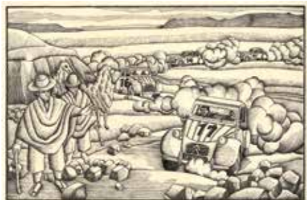
Dessin pour la brochure publicitaire Les grandes heures de la 2 CV. La 2 CV triomphe au grand prix d'Argentine , 1966, encre, 34,85 x 46 cm. Collection particulière.

Alain Le Foll est né en 1934 et décédé en 1981, à l'âge de 46 ans. Malgré la brièveté de sa carrière, il est considéré comme l'un des plus grands dessinateurs français des années 1960-1970. A l'occasion du 40 e anniversaire de sa disparition, cette exposition permet de découvrir l'œuvre de cet artiste singulier qui a contribué à façonner l'univers visuel de cette époque.