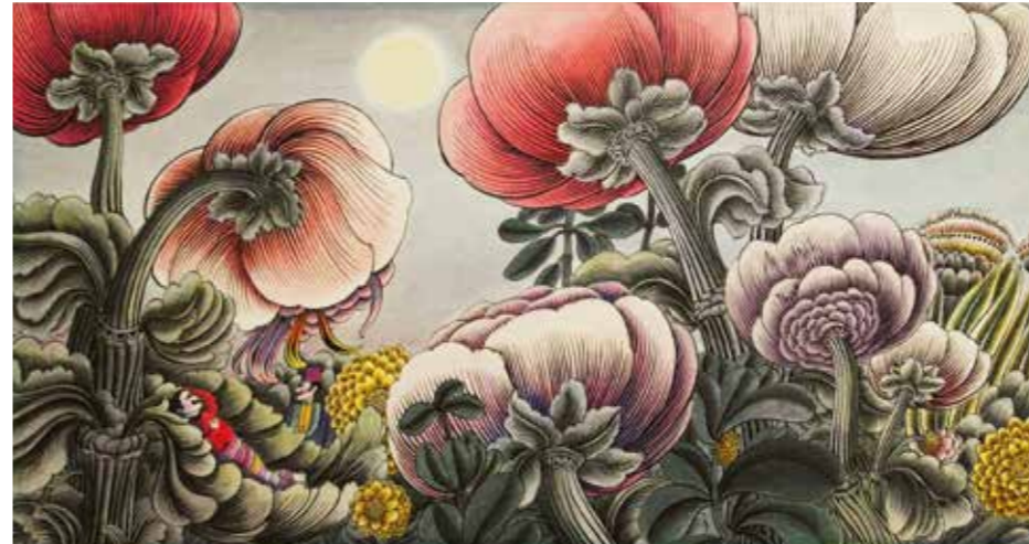
Dessin pour C'est le bouquet ! , 1964, 23 x 44 cm, encre. Collection particulière