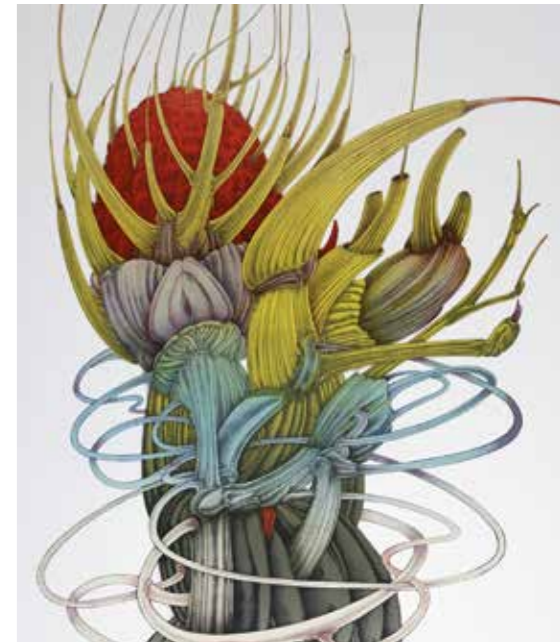
Fleur d'Afrique , 1972, lithographie, 78,6 x 56,6 cm. Collection particulière.

En 1974, il commence à travailler pour la manufacture de papiers peints Zuber qui cherche alors à moderniser ses décors afin qu'ils puissent s'harmoniser avec le design contemporain : la collection des Paysages éditée entre 1975 et 1980, pour laquelle Alain Le Foll crée plusieurs modèles, s'inscrit dans cette politique.