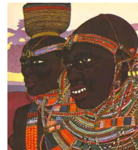
Illustration du livre de Monica Bailey, Black African Cook Book . San Francisco, Determined Productions, 1971. Collection particulière.