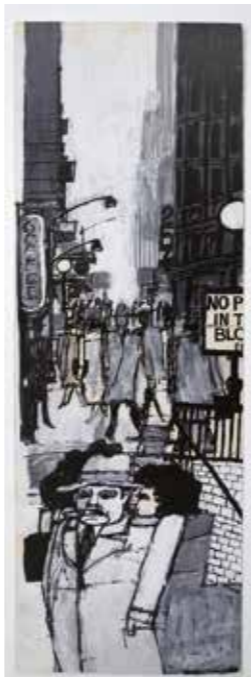
Dessin pour l'illustration du feuilleton Rien n'est trop beau de Rona Jaffe paru dans Elle , 1959, encre de Chine, plume et pinceau, rehauts à la gouache blanche, crayon à papier, 48 x 15,30 cm. Collection particulière.