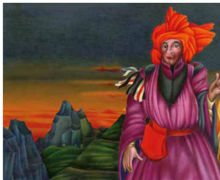
Dessin paru pour illustrer un article de Cécil Saint-Laurent, « La mode unisexe à 700 ans », paru dans Marie-Claire , 1970, encre et gouache, 46 x 60 cm. Collection particulière.