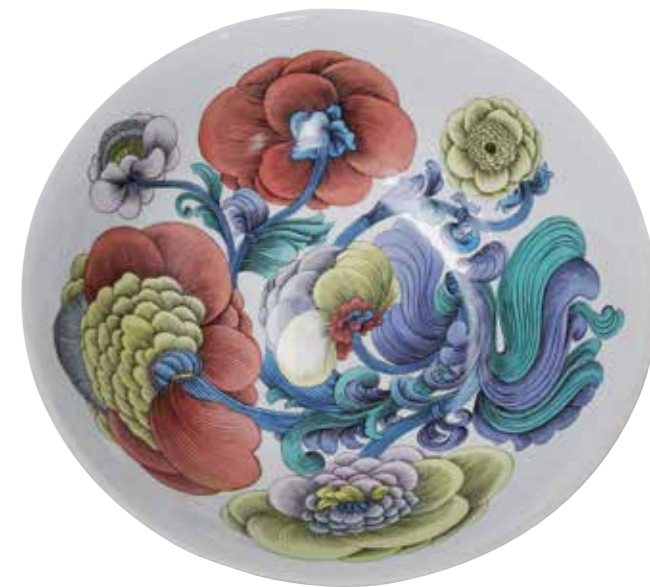
Coupe, 1966, porcelaine fabriquée à la manufacture Rosenthal, diamètre : 49,5 cm. Collection particulière.