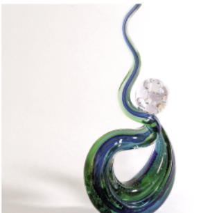
CARLSSON Sven-Ake, The Wave , 2014.

Verre soufflé multicouche avec bille collée à chaud. Signé « « Transjö Sweden S.A Carlsson ».