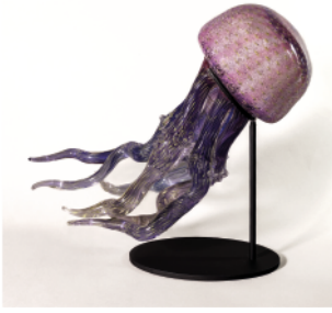
REZZONICO Irene, Medusa , 1989.

Verre soufflé multicouche polychrome et bullé, travaillé et collé à chaud. Réalisée pour Berengo.