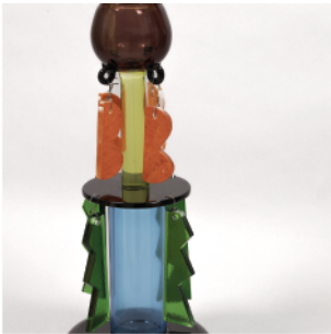
SOTTASS Ettore, Clesitera , 1989.

Exécutée à Berengo Studio Glass Furnace à Murano, Signée Ettore Sottsass per Memphis Murano.