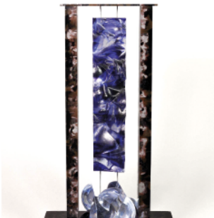
LEPERLIER Etienne, Empreinte suspendue , 1995.

Verre optique massif coulé et moulé à la cire perdue. Signature au-dessous gravée à la pointe « Antoine Leperlier 951022 1/1 ».