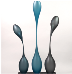
DRIVSHOLM Trine, Blue Longneck , 2010 – 2012.