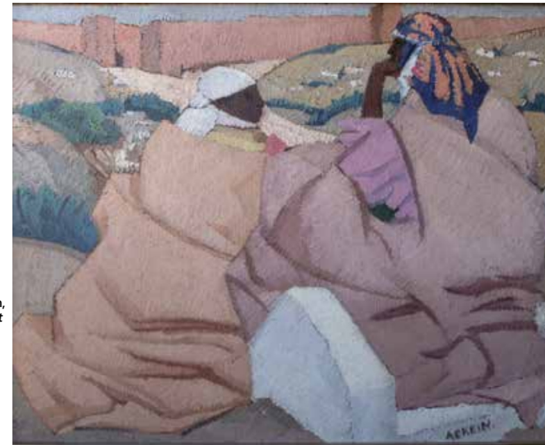
Marcelle Ackein, Femmes devant les remparts , sans date, huile sur toile, 81 x 100 cm, collection Benjamin Gastaud © Mirela Popa. DR

Entre les deux-guerres mondiales, nombres de femmes artistes, formées à l'École des beaux-arts de Paris, bénéficient de bourses de voyages ou de résidences artistiques à la Casa de Velázquez, relocalisée à Fez au Maroc. Ces voyages leur permettent de développer leur identité artistique, sans renier leur formation académique.