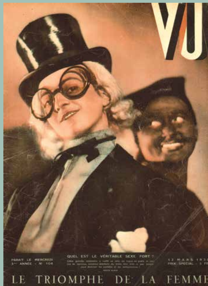
VU n°104, Alban, 12 mars 1930

Auditorium du Palais Lumière, 17h. 16€/ 13€ (tarif réduit). Inclus une visite de l'exposition pendant les heures d'ouverture au public. Billetterie et réservation à l'accueil.