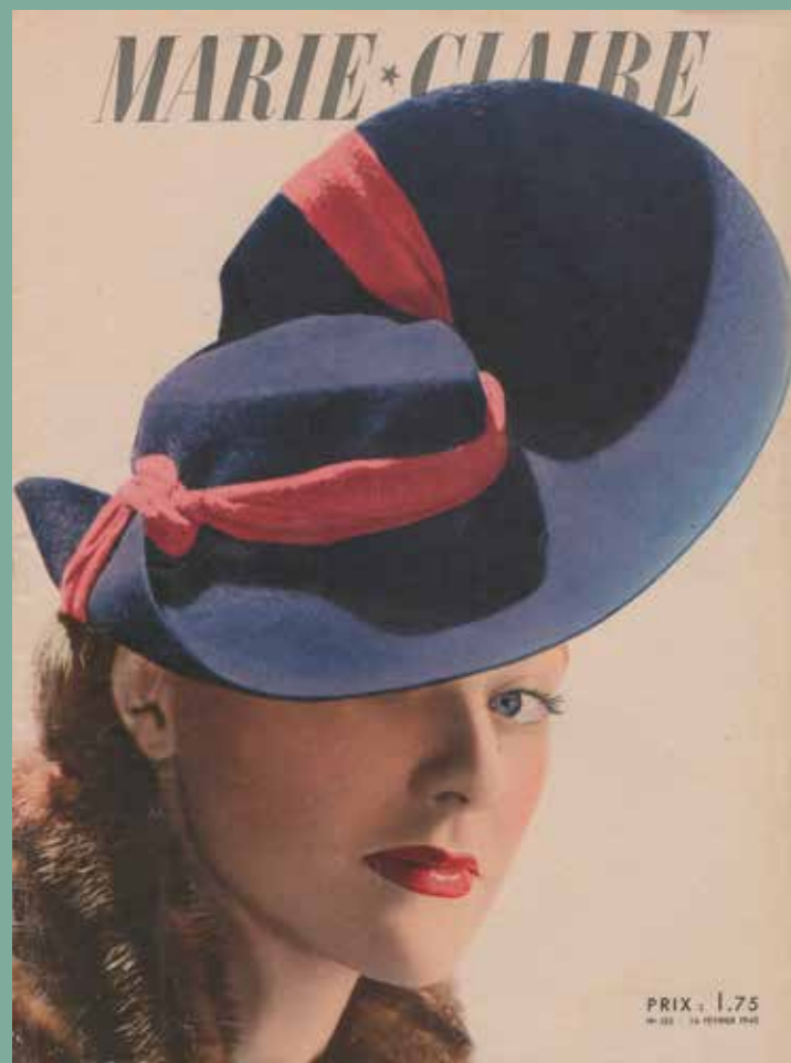
Marie Claire n°151, 1940

Palais Lumière, 14h-16h. stage de deux jours (2 x 2h) précédé d'une courte visite de l'exposition (30 min). Sur réservation au 04 50 83 15 90 : 8€ / enfant les 2 jours.