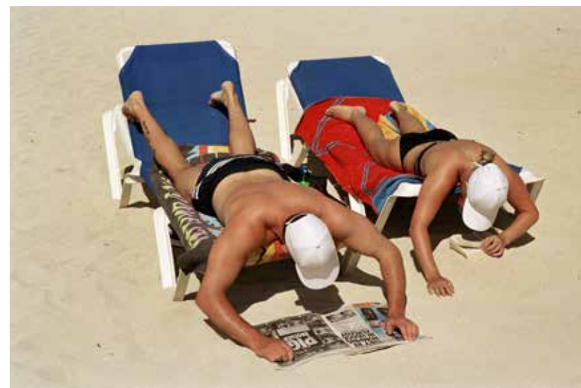
Bain de soleil et lecture sur la plage. Magaluf, Majorque, Espagne, 2003.