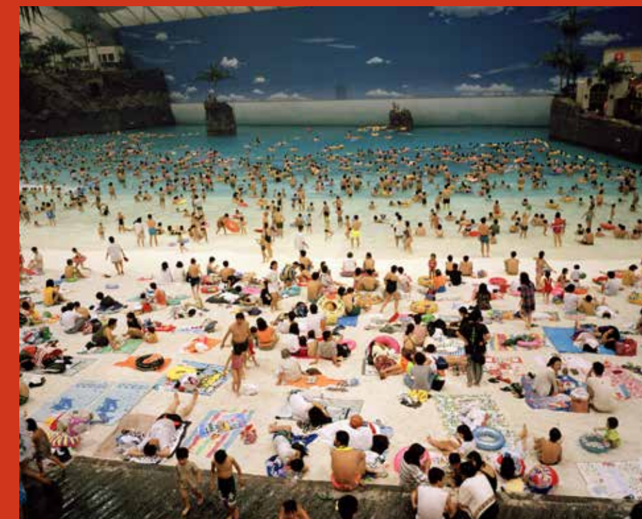
La plage artificielle du Ocean Dome. Miyazaki, Japon. 1996.