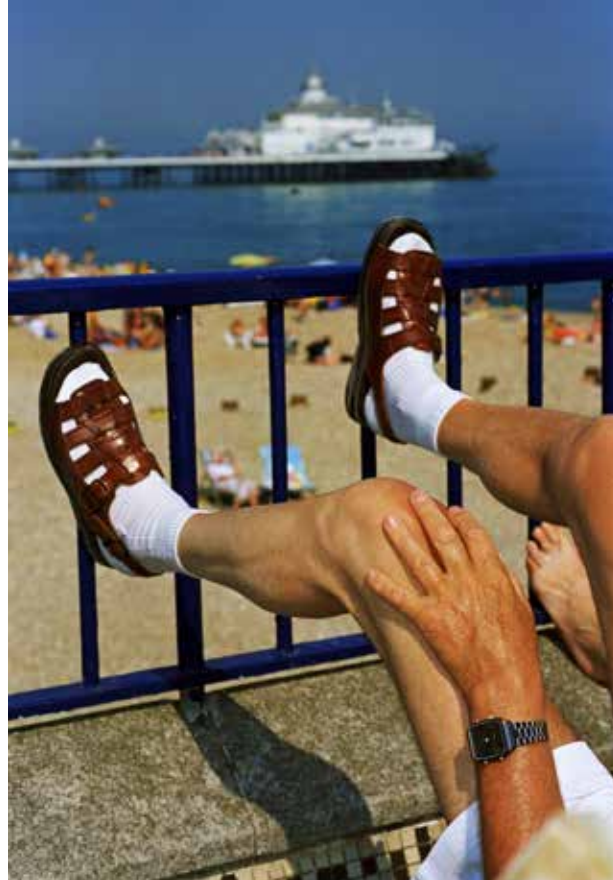
Eastbourne, Angleterre, 1995-99.