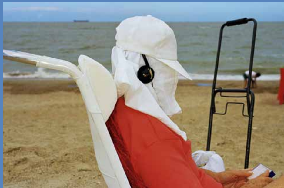
Knokke, Belgique, 2001.

Auditorium du Palais Lumière, 18h30. Entrée libre.