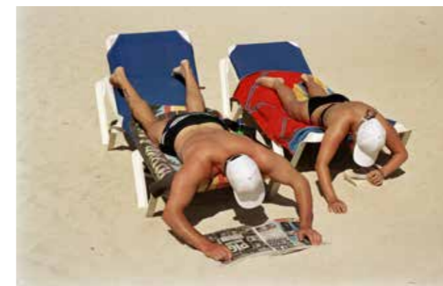
Bain de soleil et lecture sur la plage. Magaluf, Majorque, Espagne, 2003.