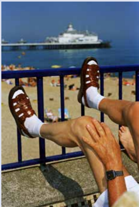
Eastbourne, Angleterre, 1995-99.