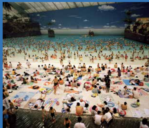
La plage artificielle du Ocean Dome. Miyazaki, Japon. 1996.