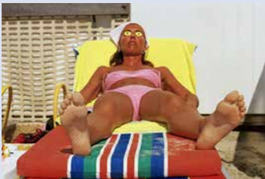
Knokke, Belgique. 2001.

Invité par la Ville d'Evian en juillet 2015, Martin Parr a arpenté la ville, réalisé des prises de vue dans des lieux emblématiques des Évianais et des touristes : l'usine des eaux d'Evian, la barque La Savoie, les thermes, une vedette de la Compagnie générale de navigation, l'hôtel Royal, un toiletteur pour chien, la place Charles-de-Gaulle, la source Cachat, le golf de l'Evian Resort, une fromagerie, la piscine... Ces