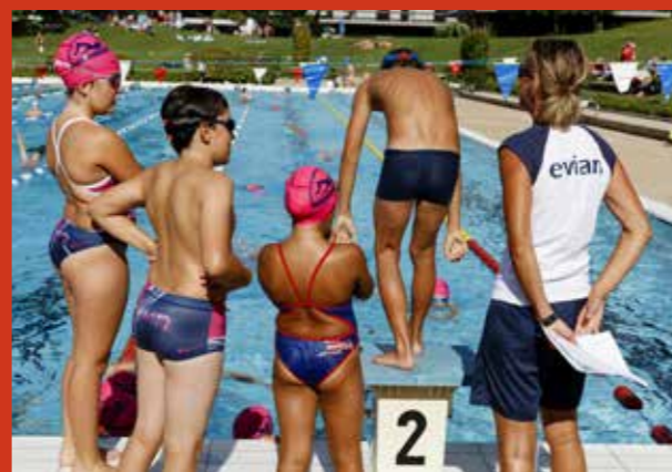
Piscine, Evian, France, 2015.