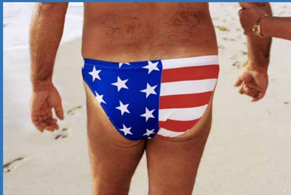
Miami, Floride, Etats-Unis, 1998.