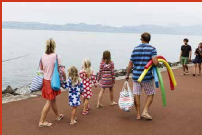
Evian, France, 2015.

L'agence Magnum Photos a été fondée en 1947. Elle doit son existence à quatre photographes : Henri Cartier-Bresson, Robert Capa, George Rodger et David 'Chim' Seymour . Ils ont créé Magnum Photos à leur image, c'est-à-dire une agence qui accorde autant d'intérêt à la chose vue qu'à la façon de la voir. Initialement installée à Paris et à New York elle est aussi présente à Londres et à Tokyo. Magnum Photos s'est écartée de façon radicale des pratiques conventionnelles de la presse à l'époque de sa création. Sa structure est une coopérative d'actionnaires-photographes et les droits d'auteurs sont la propriété exclusive des photographes. Ainsi, ces derniers se donnent les moyens de leur indépendance, corollaire indispensable de leur engagement. Ils choisissent les reportages et leur durée, ils sélectionnent les photographies, ils conservent la propriété des négatifs, ils maîtrisent le copyright et contrôlent la diffusion des photos. Le recrutement d'un nouveau membre est un long parcours. Le candidat photographe reste sous observation pour une période de quatre à huit ans, avant de pouvoir accéder au rang de membre et donc d'actionnaire. Il doit prouver sa singularité par son écriture photographique, par sa rigueur, par la persistance de son travail de documentation et d'information. Le collectif est constitué actuellement de près de 80 photographes, dont 60 membres.