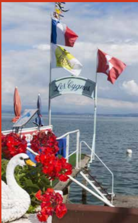
Hôtel Les Cygnes, Evian, France, 2015.